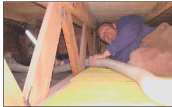
Sicher, schnell und fugenfrei