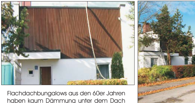
Flachdachbungalows aus den 60er Jahren haben kaum Dämmung unter dem Dach

Allein die galoppierenden Heizkosten der letzten Jahre fordern hier eine dämmtechnische Nachrüstung, um die Nebenkosten deutlich zu reduzieren.