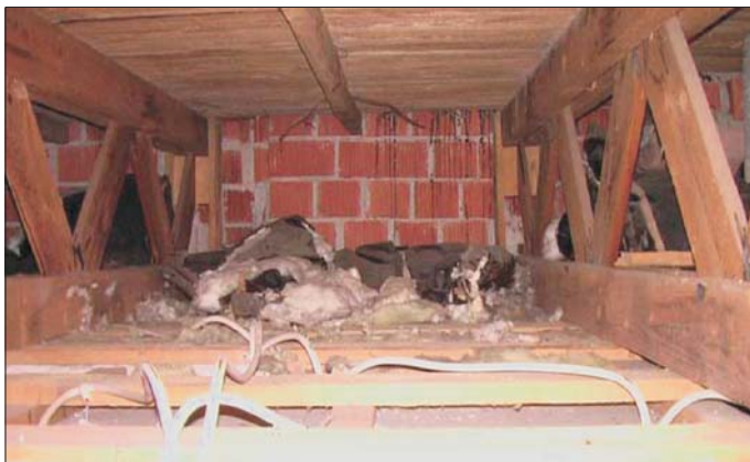
Große Flächen sind ungedämmt

Der Blick hinter die Deckenverkleidung verdeutlicht: Platz wäre genug, um eine zusätzliche Dämmung einzubringen. Der Hohlraum beträgt in der Regel zwischen 40 cm und 60 cm, die alte Dämmung ist durch nachträgliche Montagen oder Marder verrückt und größere Flächen sind ungedämmt.