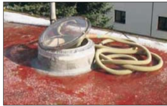
Dämmen per Schlauchleitung

Systembedingt bietet isofloc bei solchen Voraussetzungen ein paar wichtige Montagevorteile, die es ermöglichen, diese Hohlräume sicher, schnell und fugenfrei zu dämmen: